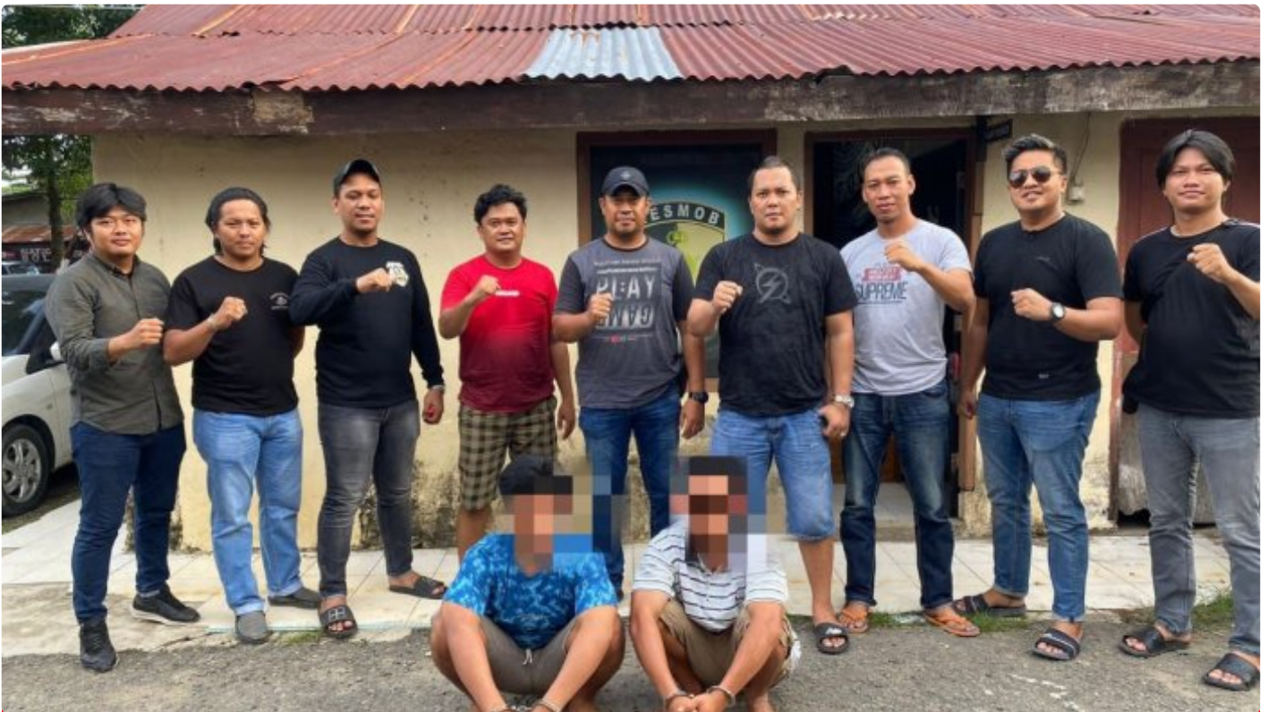
Tim Resmob Reskrim Polres Morowali saat menangkap pelaku pembunuhan

MOROWALI, Sulawesi Tengah- Pelaku penikaman perut terburai keluar hingga menyebabkan korbannya meninggal dunia inisial E (29) yang baru-baru ini terjadi di wilayah Kecamatan Bahodopi telah berhasil di tangkap Satreskrim Polres Morowali.